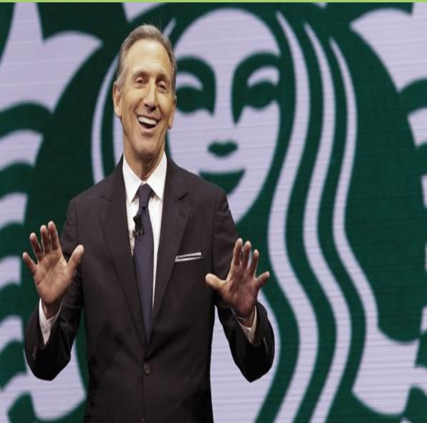
Howard Schultz ông chủ Starbucks